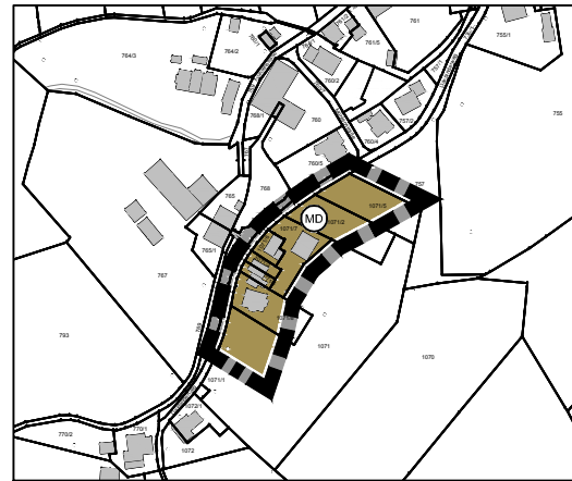
Änderungsplan M 1:5.000